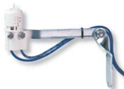
Sensori Pioggia Mini-Clik

N on c'è niente di più imbarazzante e costoso o spreco più grande che avere un sistema di irrigazione che funziona quando non deve, ovvero sotto la pioggia. Il sensore Mini-Clik® rappresenta il modo più semplice ed efficace per evitare l'attivazione degli irrigatori durante o dopo le precipitazioni. Si installa facilmente su qualsiasi sistema di irrigazione automatico, blocca gli irrigatori durante la pioggia mantenendoli automaticamente disattivati per un periodo proporzionale alla durata delle precipitazioni. I dischi assorbono l'acqua e si espandono in modo proporzionale alla quantità di pioggia caduta (ad esempio, un breve acquazzone provocherà un assorbimento limitato, mentre una pioggia